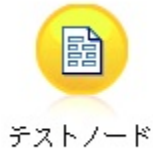
Figure 4. Libellé de noeud contenant des caractères non ASCII affiché correctement

Une chaîne Unicode est créée et le libellé s'affiche correctement.