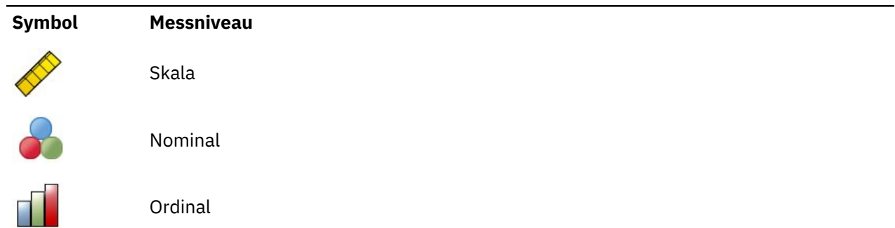
Tabelle 1. Messniveausymbole

Sie können das Messniveau für eine Variable vorübergehend ändern. Klicken Sie hierzu mit der rechten Maustaste in der Liste der Quellenvariablen auf die entsprechende Variable und wählen Sie das gewünschte Messniveau im Popup-Menü.