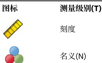
表 1. 测量级别图标