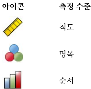
표 1. 측정 수준 아이콘

소스 변수 목록에서 변수를 마우스 오른쪽 단추로 클릭하고 팝업 메뉴에서 측정 수준을 선택하여 변수에 대한 측정 수준을 임시로 변경할 수 있습니다.