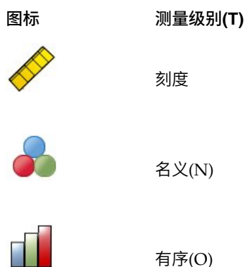
表 1. 测量级别图标.

可以暂时更改变量的测量级别，方法是在源变量列表中右键单击该变量，然后从弹出菜单中选择测量级别。